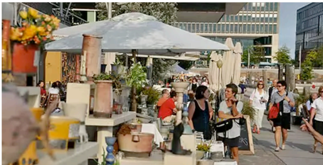
Bei über 60 Ausstellern können die Besucher der Keramiktage in der Hafencity stöbern, kaufen und das Töpfern selbst ausprobieren.

Die Hafencity Hamburg GmbH ist nicht verantwortlich für die Inhalte externer Internetseiten und macht sich solche Inhalte nicht zu eigen.